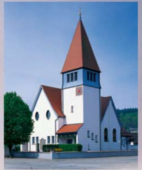
Biserica Gustav Adolf, Affolterbach/Odw. Construită în 1906, arhitect: Prof. Pützer. Complet restaurată în 2001 cu vopsea de interior Sylitol Bio- Innenfarbe