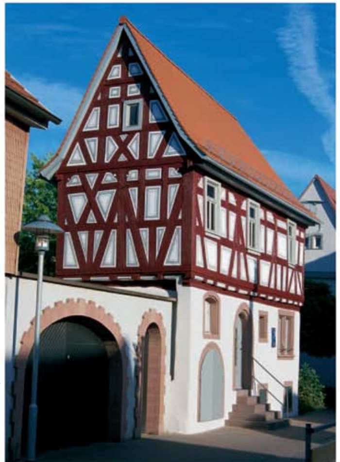
Dieburg (Hessen), cea mai veche clădire a oraşului