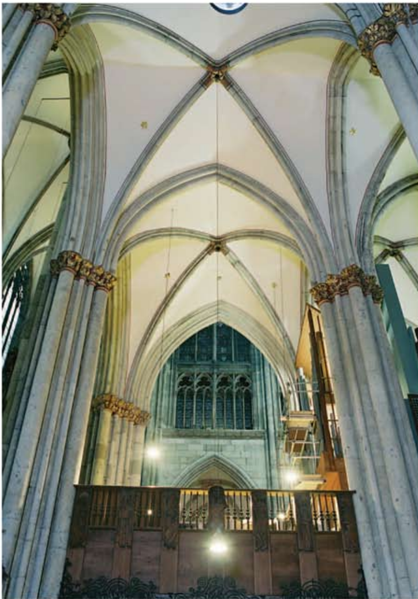
Domul din Köln