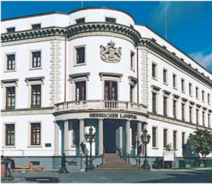
Consiliul municipal Weisbaden