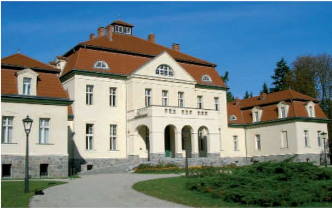
Hotel Rittergut Liebenberg