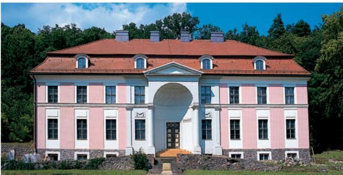
Băile Freienwalde (Brandenburg)