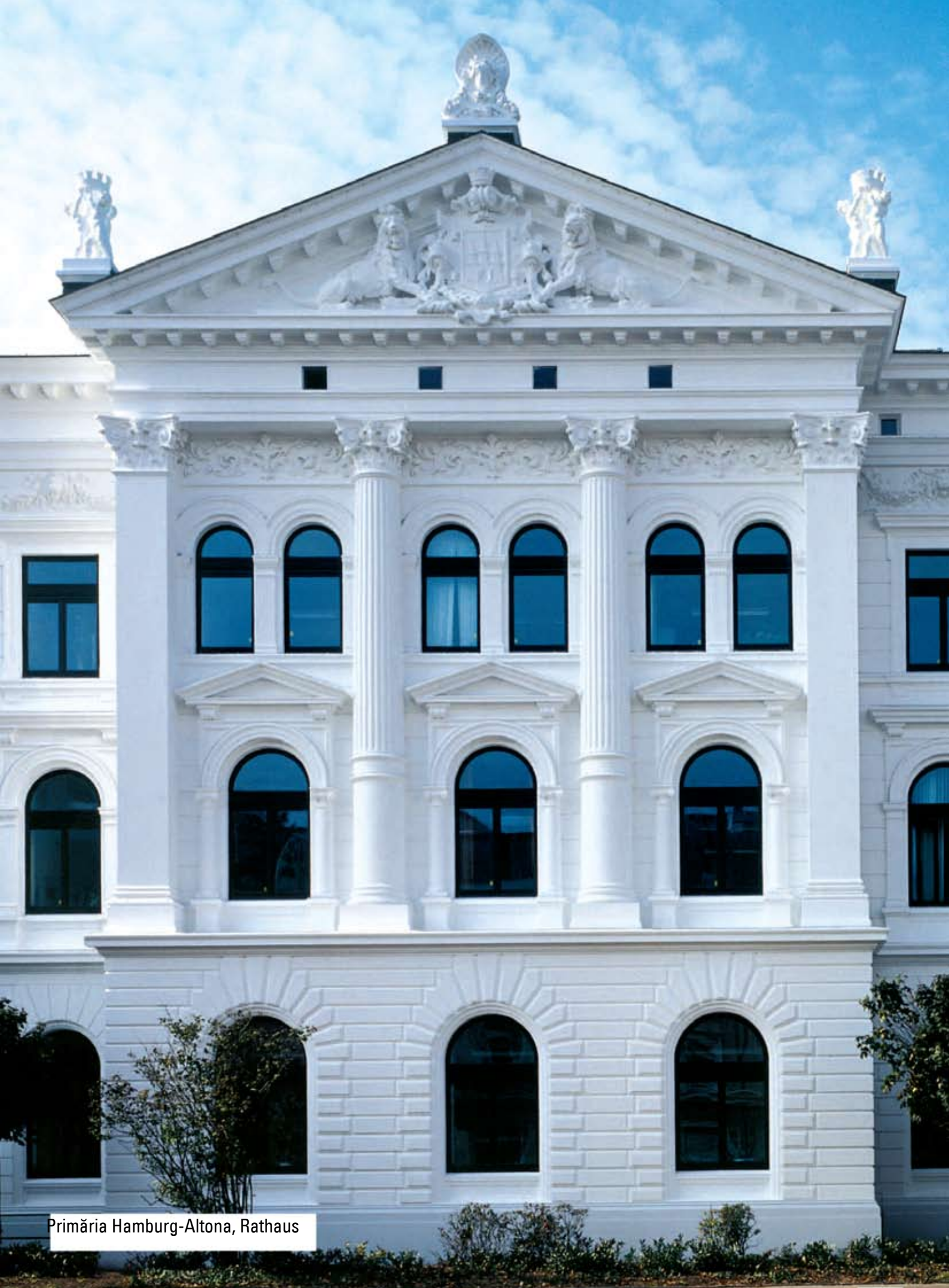
Primăria Hamburg-Altona, Rathaus