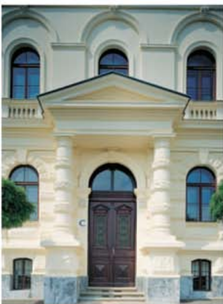
Intrare St. Odilien