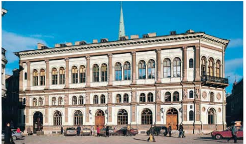
Bursa din Riga