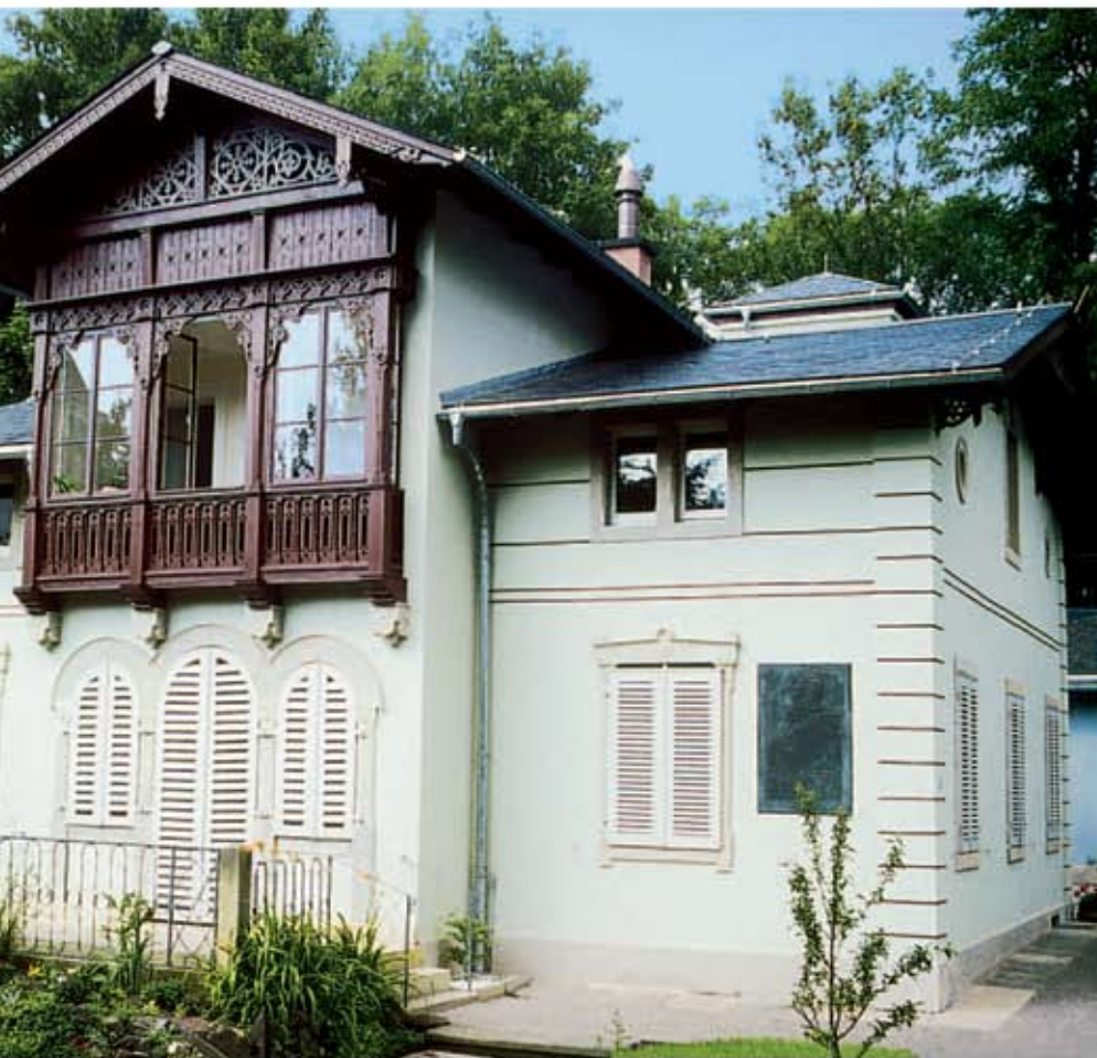
Muzeul Kraszewski, Dresda