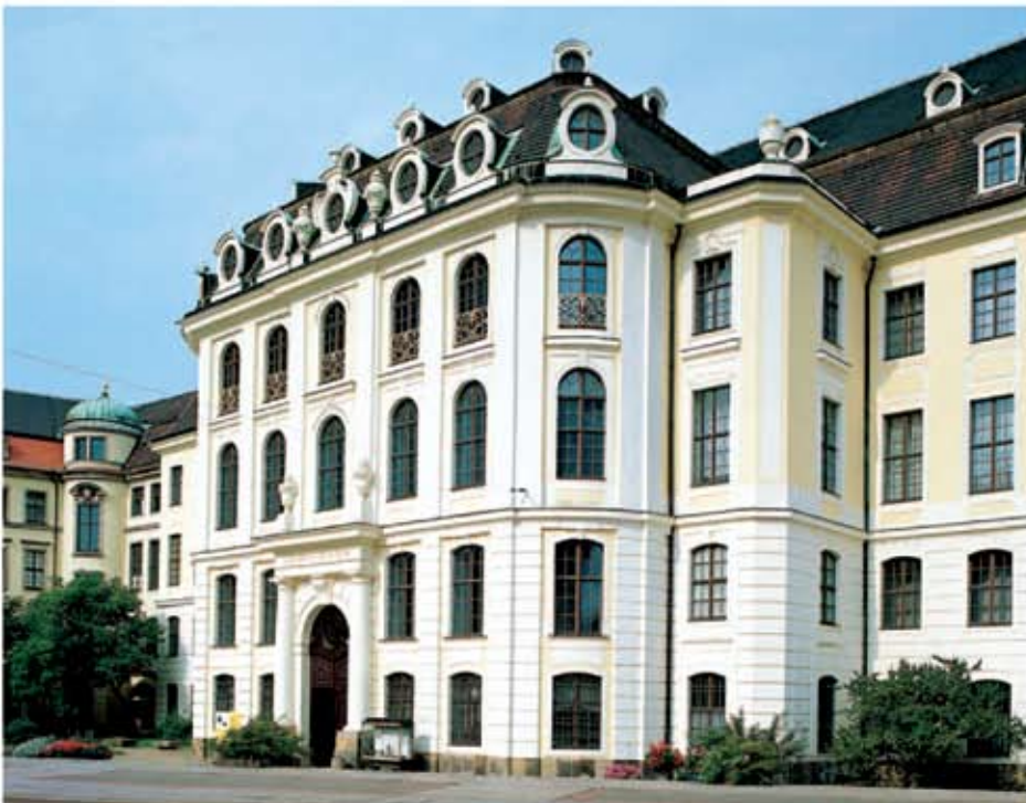
Mezeul oraşului Dresda