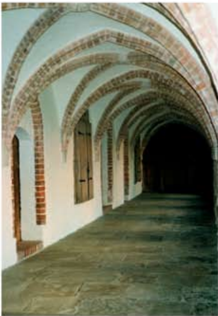
Mănăstirea Isenhausen, Kreuzgang