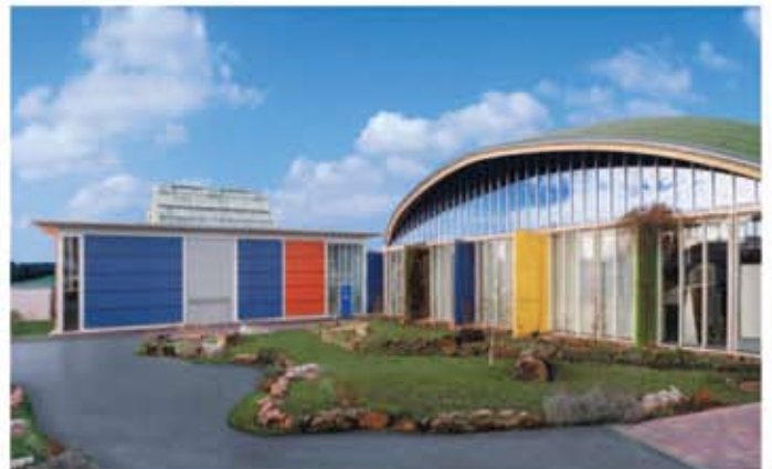
Casa meșteșugarilor și a tehnicilor de aplicare. Centrul din Ober - Ramstadt