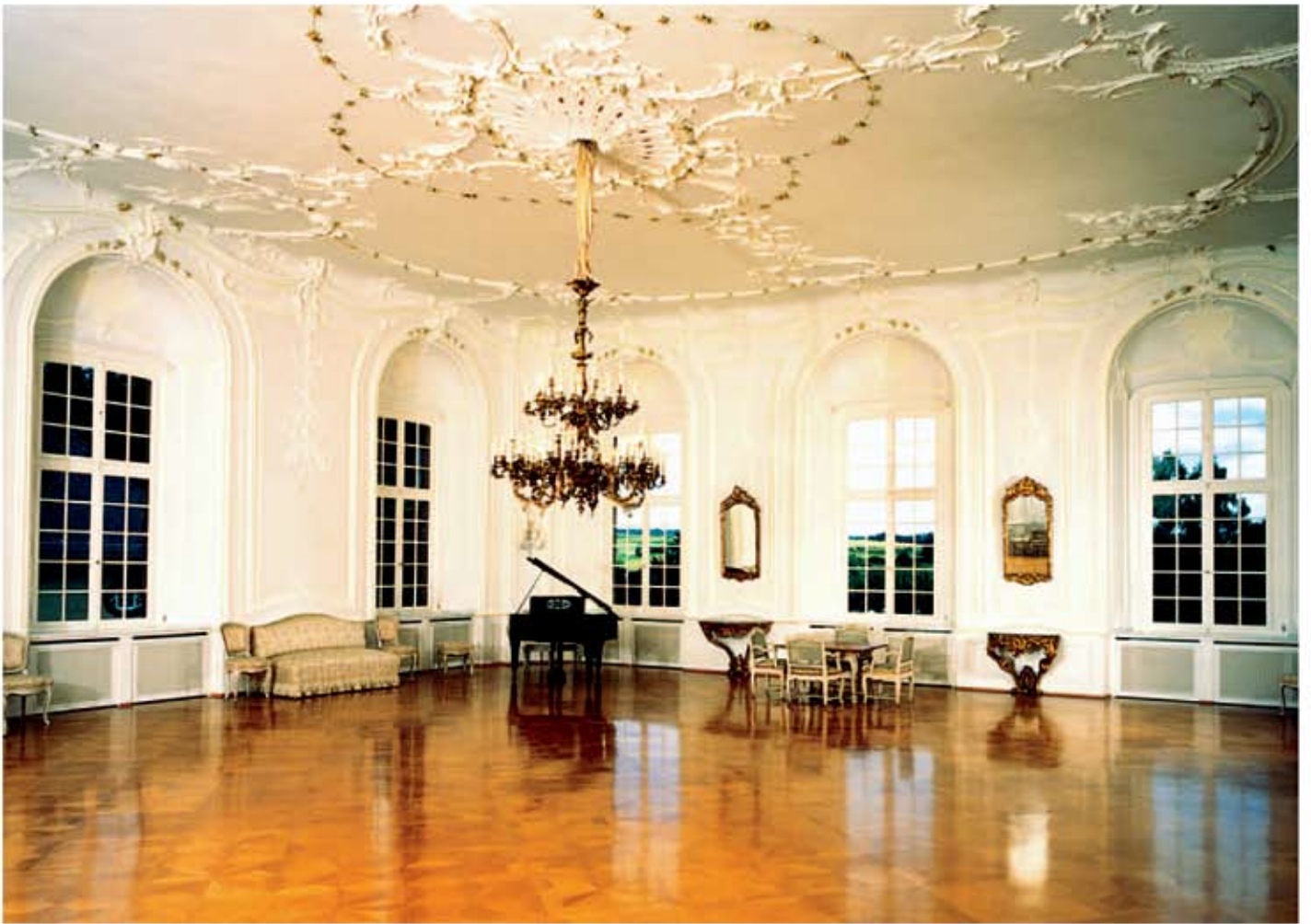
Castel Birstein (Hessen)