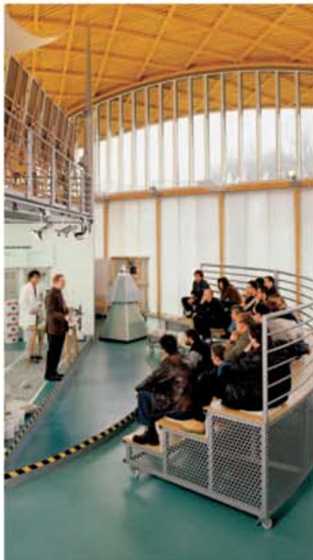
Imagine din "Casa meșteșugarilor"

În acord cu referenții de la Caparol, se pot organiza seminarii la sediul firmelor, al Camerelor de Comerț și al centrelor de instruire. Centrul de școlarizare Berlin