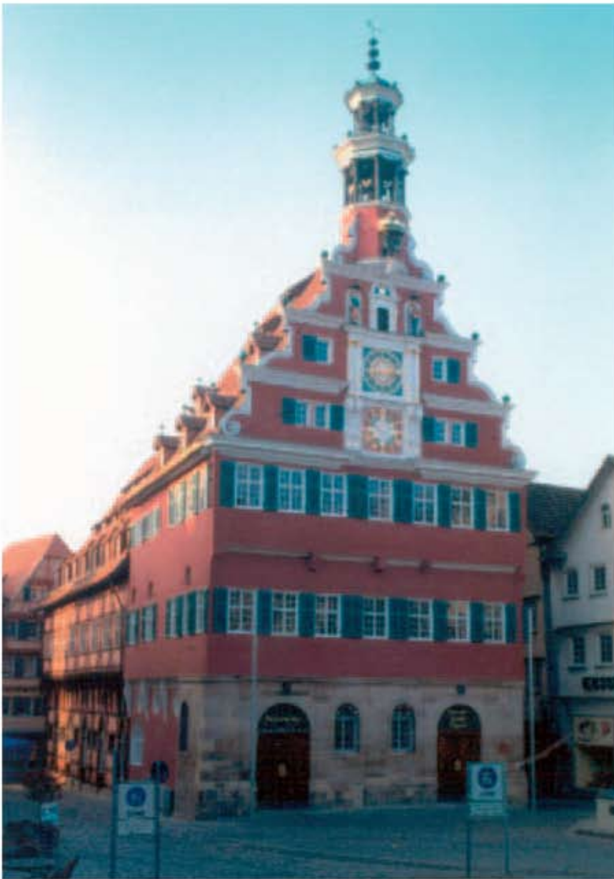
Primăria Esslingen am Necktar