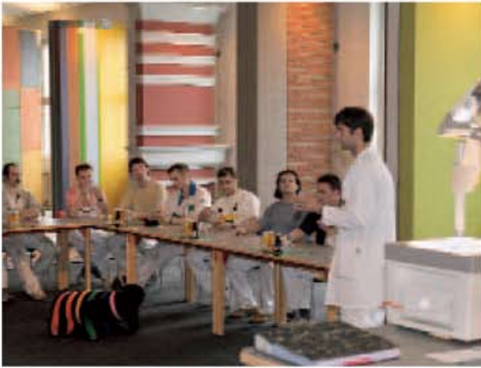
Centrul de școlarizare Berlin

La Centrele de școlarizare din Ober-Ramstadt și din Berlin, personalul de specialitate și experții, împărtășesc cunoștințele practice publicului larg.