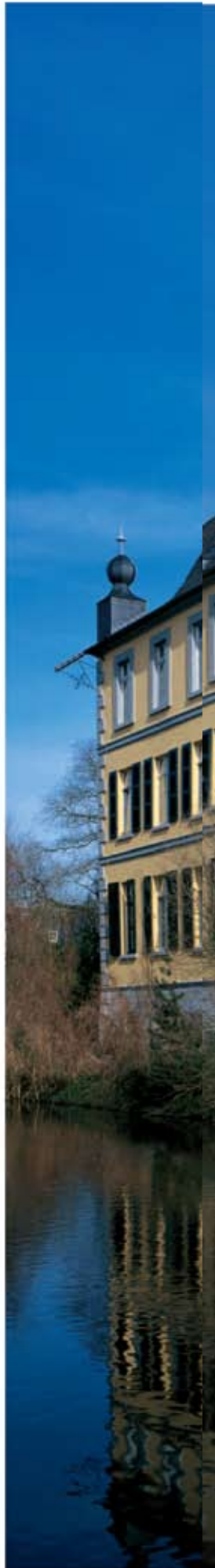
Castel Kendenich Hürth, lângă Köln