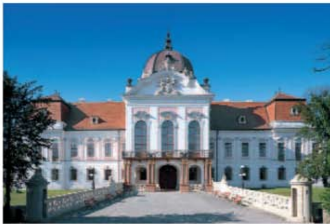
Castelul Grassalkovich la Gödöllő (Ungaria)