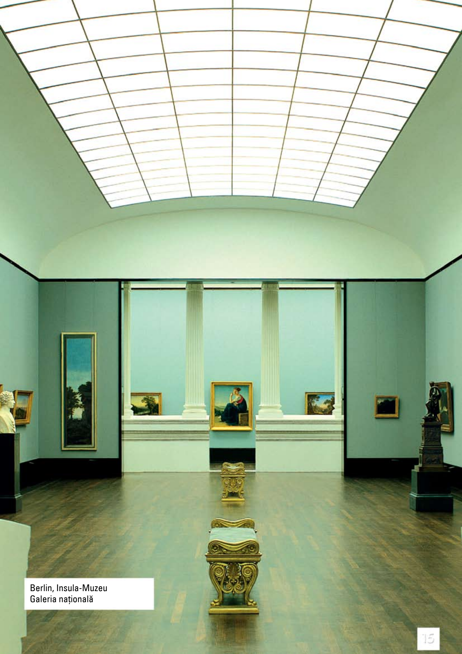
Berlin, Insula-Muzeu Galeria națională