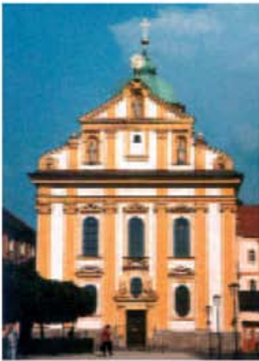
Altötting (Bayern), Biserica St. Magdalena