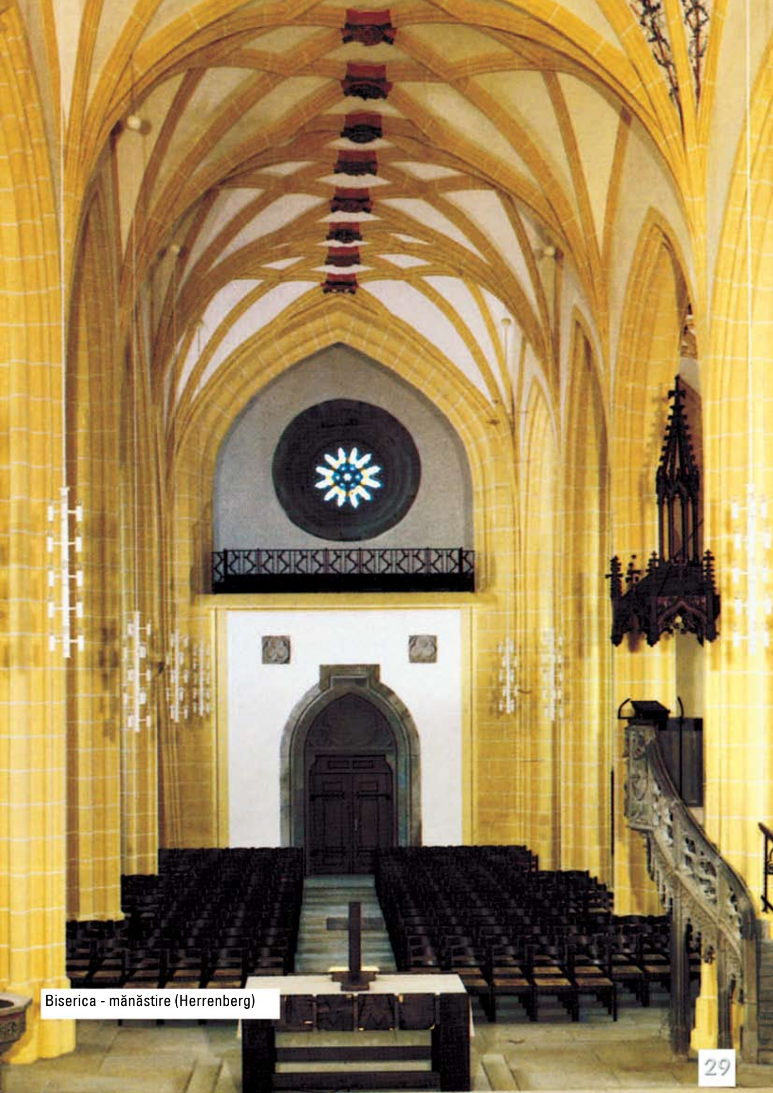
Biserica - mănăstire (Herrenberg)