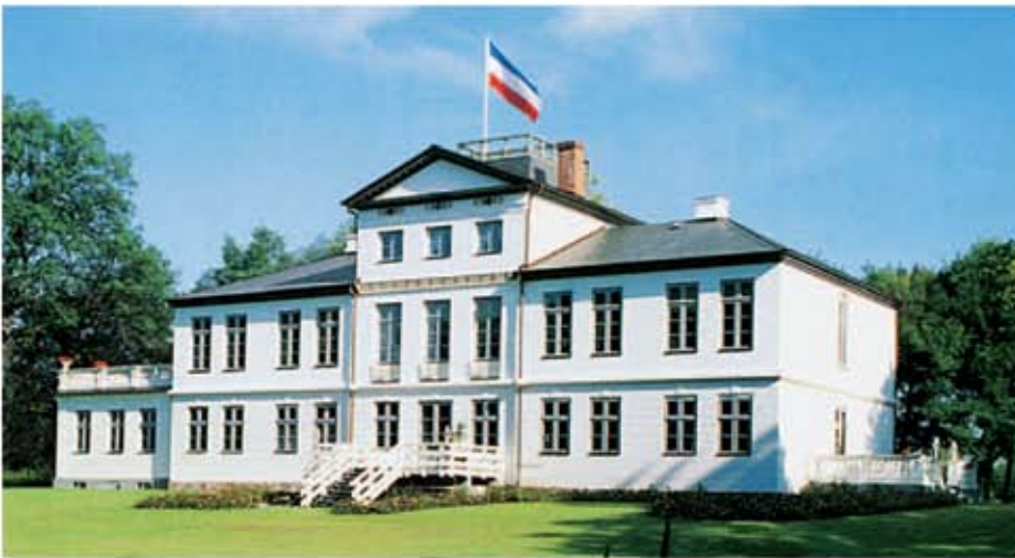
Bovenau, lângă Rendburg

deosebită, recunoscute și apreciate de-a lungul anilor. Fie că este vorba de vopsea silicatică simplă, vopsea silicatică de dispersie, vopsea silicatică de umplură sau lazură silicatică, prin intermediul sortimentului silitolic sunt rezolvate cele mai diverse lucrări din domeniul renovării și restaurării clădirilor monument - istoric.