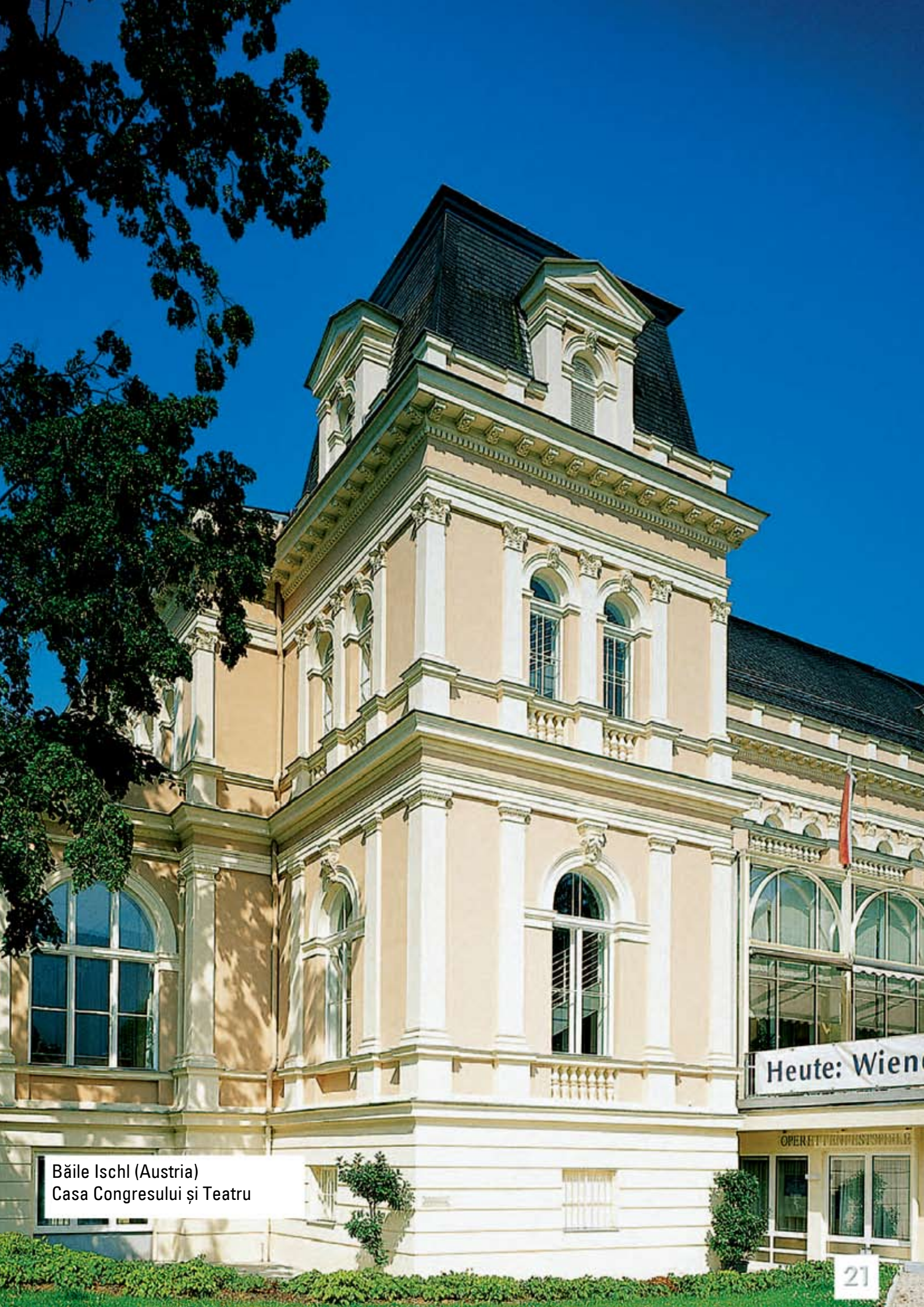
Băile Ischl (Austria) Casa Congresului și Teatru