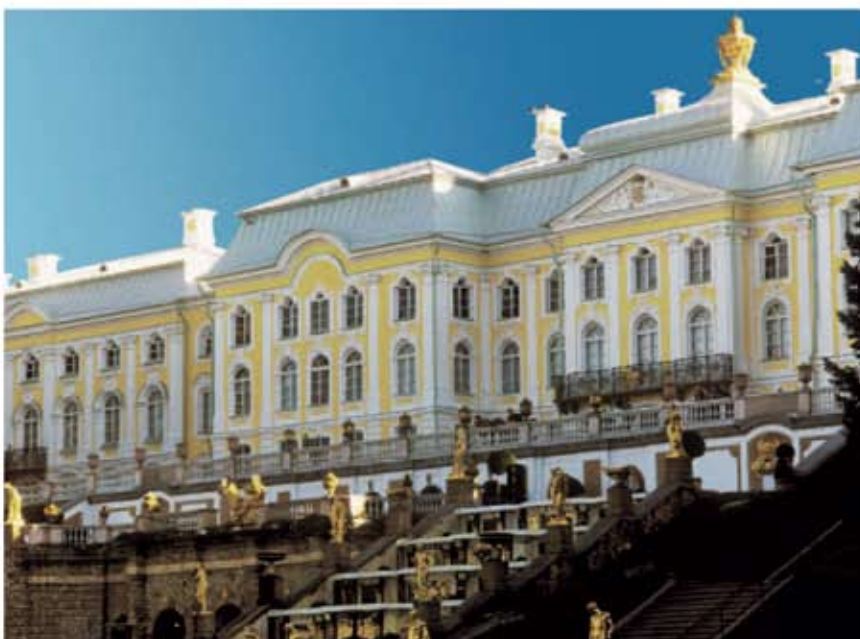
Palatul Peterhof, St. Petersburg