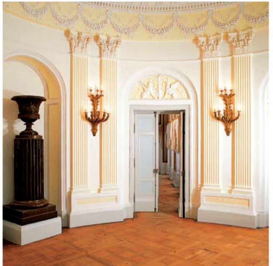
Castel Monrepos, Ludwigsburg