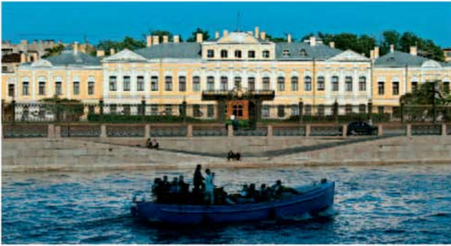
Palatul Scheremtiev, St. Petersburg