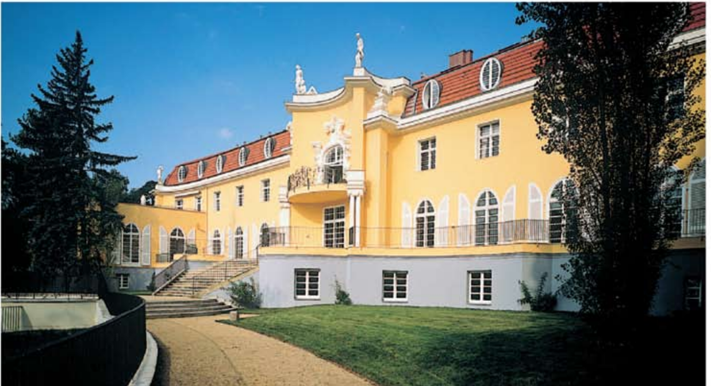
Berlin - Grunewald, Casa Konschewski