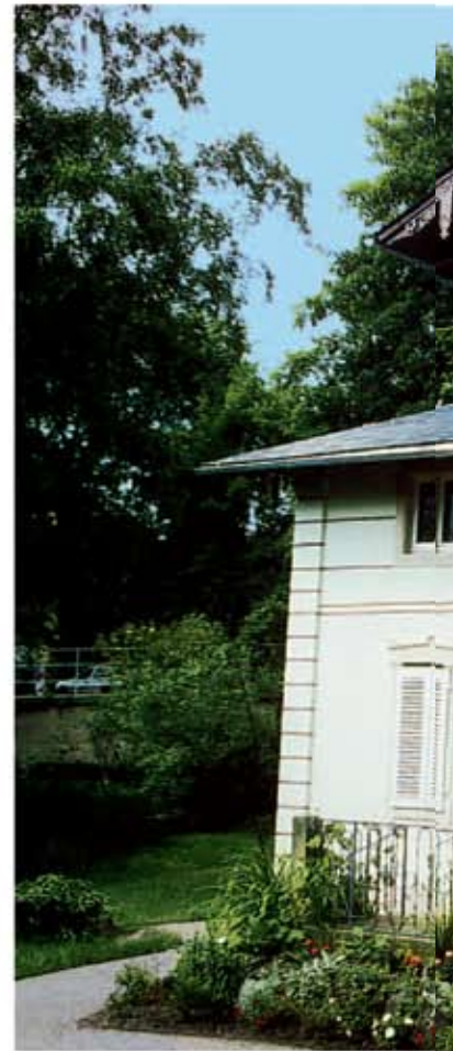
Turnul de apă, Neu - Ulm