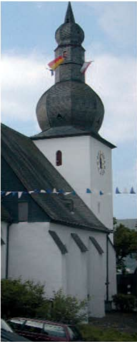
Arnsberg, Capela oraşului și turnul cu ceas