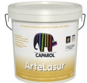
Ambalaj 2,5 și 5 litri

Capadecor ArteLasur este o lazură specială, cu aspect estetic deosebit de atractiv, cu aplicare economică, pentru decorarea suprafețelor interioare netede sau ușor structurate. Lazura are în componență particule albe, nepigmentabile sub formă de fulgi. Datorită tehnicii de aplicare, aceste particule conferă un aspect vizual deosebit, individualizat. Recomandată pentru decorarea suprafețelor interioare, ca de exemplu: birouri, săli de conferințe, săli de protocol, restaurante cu personalitate, hoteluri și camere de locuit, Capadecor ArteLasur reușește accentuarea unor zone speciale și conferă efecte optice deosebite.