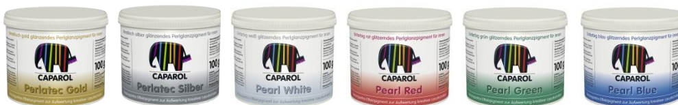
Pigmenți lucioși, într-o singură nuanță, cu luciu metallic: Gold; Silber; White; Red; Green; Blue