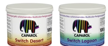
Pigmenți cu luciu metallic, efect perlat și nuanțe multiple "Cameleon" Swich Desert ; Swich Lagoon