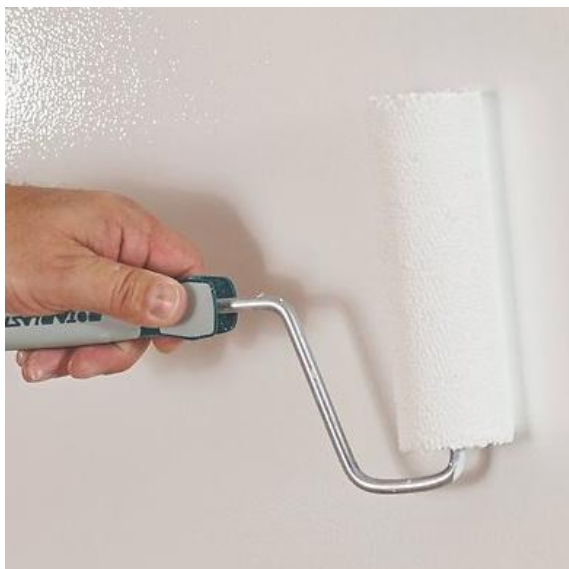
Etapa 3: aplicarea cu rola a primului strat de Caparol Whiteboard Paint, cca 100-120 ml/m 2