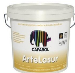
Ambalaj 2,5 și 5 litri

Capadecor ArteLasur este o lazură specială, cu aspect estetic deosebit de atractiv, cu aplicare economică, pentru decorarea suprafețelor interioare netede sau ușor structurate. Lazura are în componență particule albe, nepigmentabile sub formă de fulgi. Datorită tehnicii de aplicare, aceste particule conferă un aspect vizual deosebit, individualizat. Recomandată pentru decorarea suprafețelor interioare, ca de exemplu: birouri, săli de conferințe, săli de protocol, restaurante cu personalitate, hoteluri și camere de locuit, Capadecor ArteLasur reușește accentuarea unor zone speciale și conferă efecte optice deosebite.