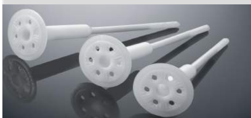
Diblu STR U 2G