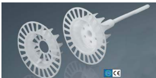
Rozetă VT 2G + Diblu STR U 2G